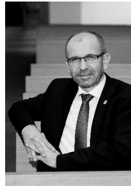
Präses Manfred Rekowski, Evangelische Kirche im Rheinland Düsseldorf, im März 2021