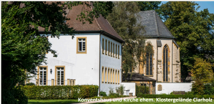
Konventshaus und Kirche ehem. Klosteranlage Clarholz