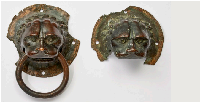
Clarholz, St. Laurentius, Türzieher, Mitte 12. Jahrhundert

Abb. Titelseite: Clarholz, St. Laurentius, Skulptur des hl. Norbert von Xanten, vom ehem. Clarholzer Lettner, Ende 15. Jahrhundert