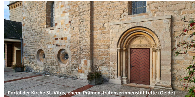
Portal der Kirche St. Vitus, ehem. Prämonstratenserinnenstift Lette (Oelde)

Zur Abtei Cappenberg und den frühen Prämonstratensern