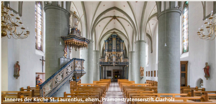
Inneres der Kirche St. Laurentius, ehem. Prämonstratenserstift Clarholz