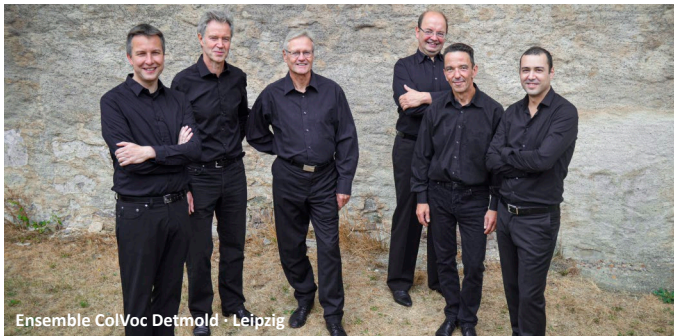
Ensemble ColVoc Detmold · Leipzig